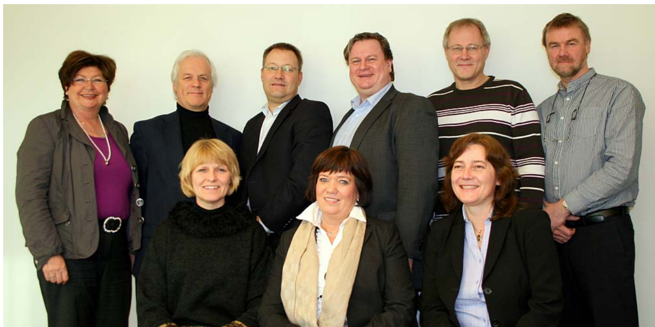
Styret i HL 2009

Også i 2009 har kommunal eiendomsskatt vært den dominerende enkeltsaken for HL. For øvrig vises det til beskrivelse av organisasjonens viktigste innsatsområder i etterfølgende avsnitt.